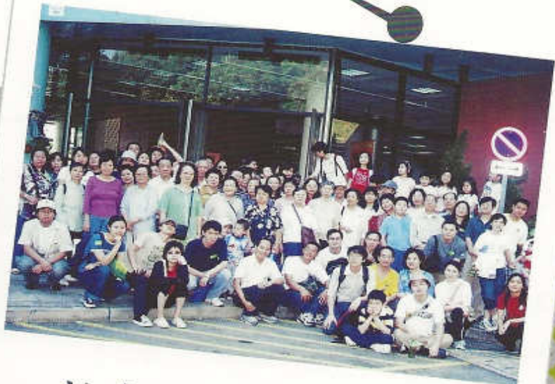
教會旅行 - 曹公潭 戶外康樂中心