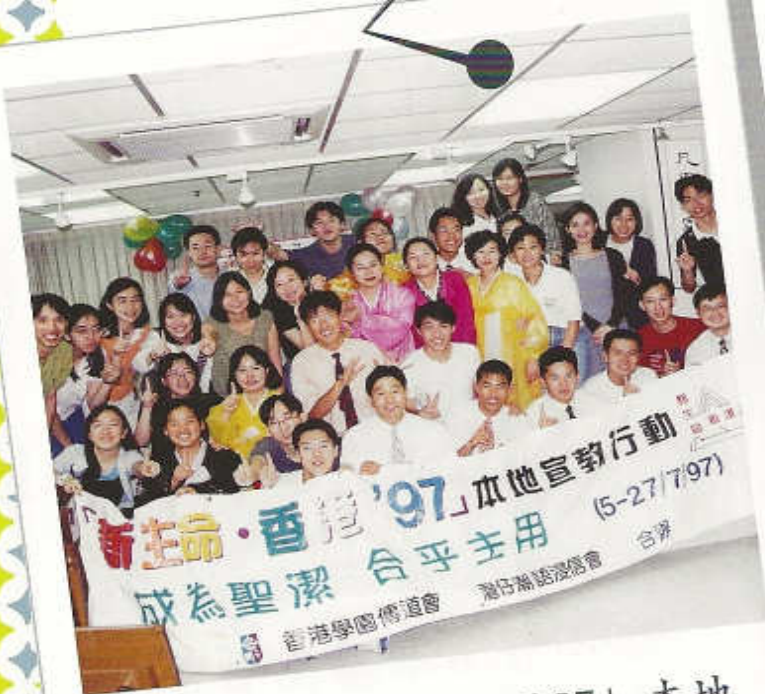
響應「新生命·香港97」本地 宣教行動，接待韓國教會信徒