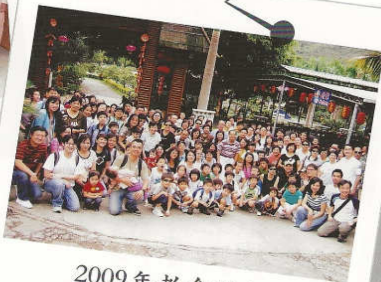
2009年教會旅行 地點：大棠荔枝莊