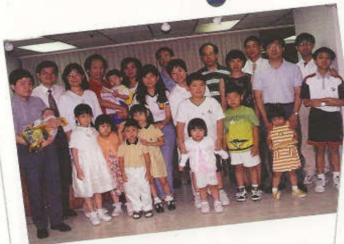
1999年第一屆 兒童奉獻禮