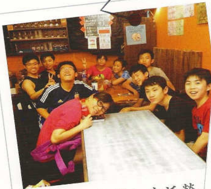
2014年「青崇」生活營 地點：長洲