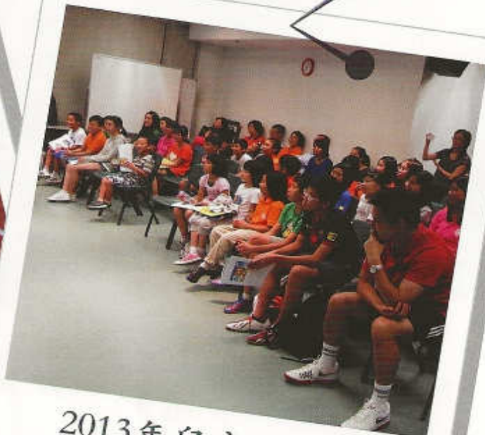
2013年兒童敬拜營 「做天父like嘅敬拜者」