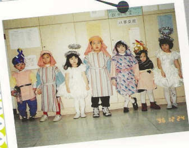
1996年日光會 學員演「聖景」