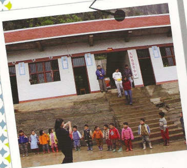
貴州慧萃小學外貌