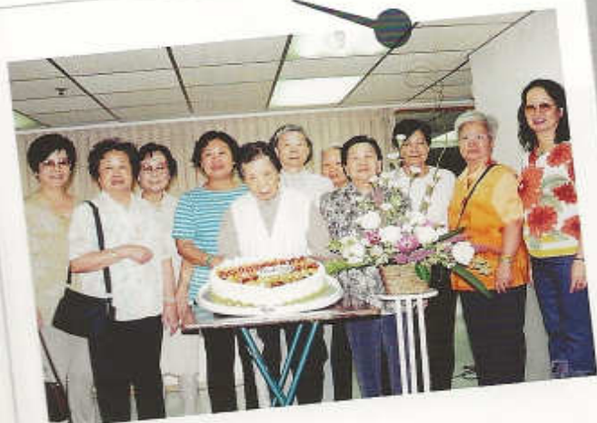
「雙親主日」迦勒團友 攝於金冠大廈堂址