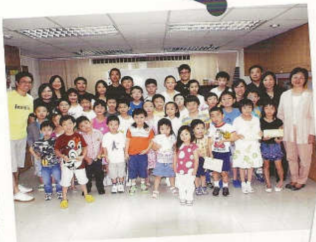
2007年日光會頒獎禮 師生大合照