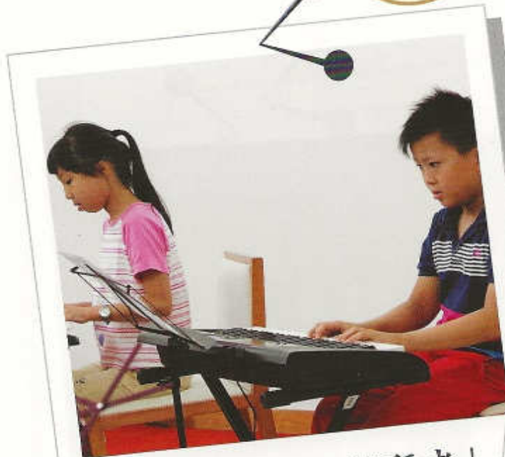
「做天父like嘅敬拜者」 鍵琴組組員