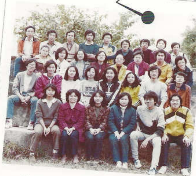
1981年第一屆冬令會 主題：「虛空的虛空」傳道書