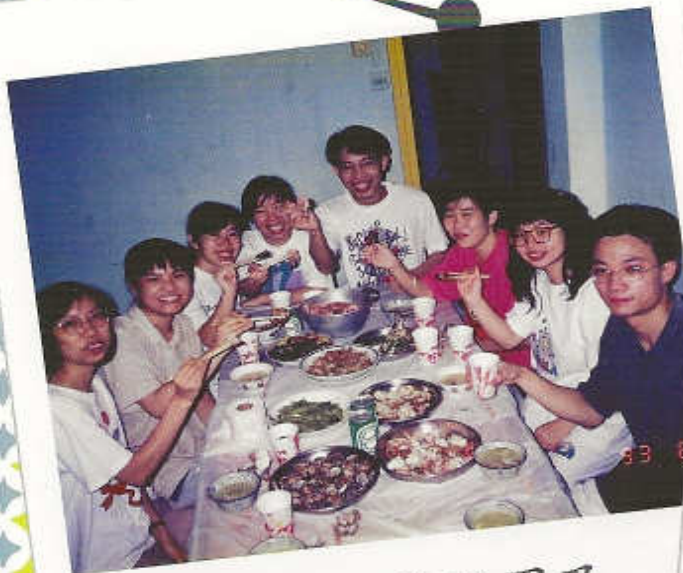
1993年以賽亞團及 以利沙團聯團生活營