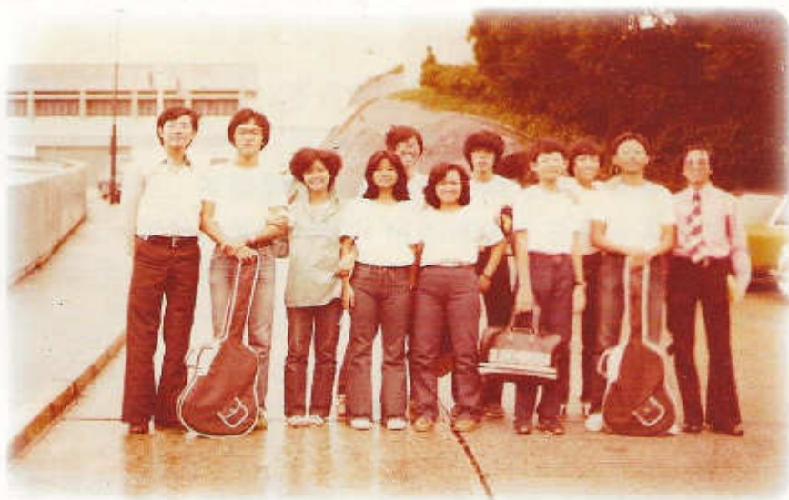
1980年「民歌佈道小組」到大潭女童院佈道

中避免提及一些較敏感的話題，例如入獄的原因)，但在分享和代禱中，我們都能感受到囚友記掛著家人，也期望出獄後能重新適應社會。