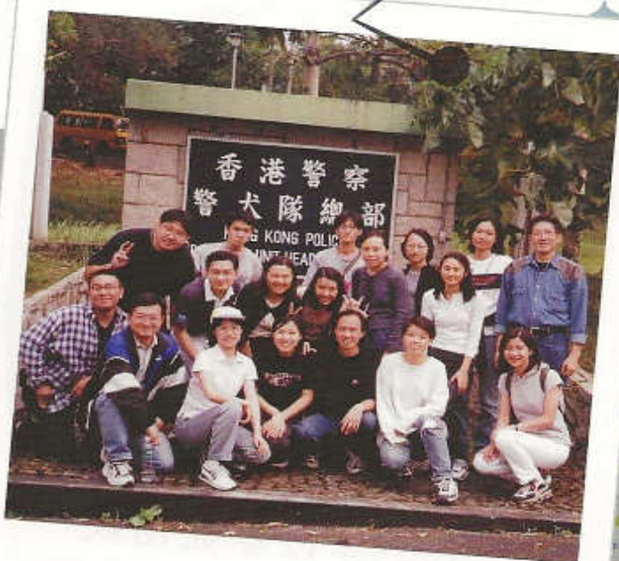
1999年以利沙團參觀 「香港警察警犬隊總部」