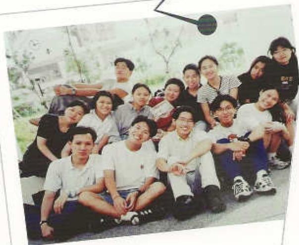
1996年撒母耳團 戶外單車樂