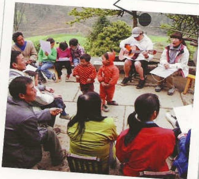
與慧萃小學師生一起唱詩