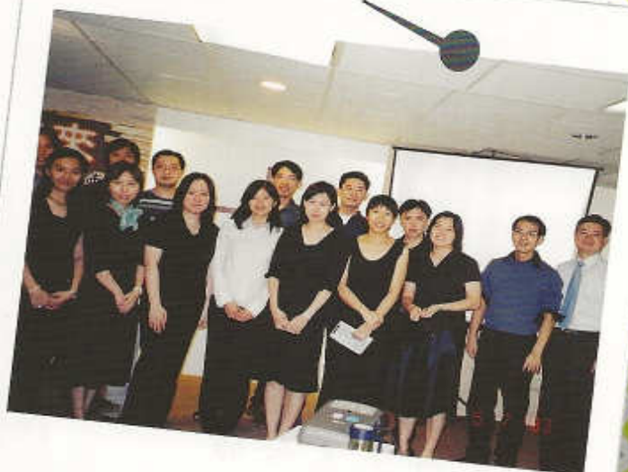
2003年敬拜隊 協助主領奮興會